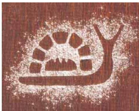
Eine Schnecke aus gestäubtem Mehl steht für die Kunst des langsamen Backens.

weise über zwölf Stunden in besondere mit kaltgepresstem Olivenöl ausgestrichenen Wannen. Und genau wie die Löcher im Käse sind die Löcher im Ciabatta oder im Baguette ein Qualitätsmerkmal für eine optimale Reife und somit ein Granat für besten Geschmack. Was